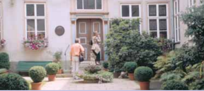
Evropská bytová kultura z období renesance a baroka

Kornblumengasse 1 35573 Wetzlar Telefon: +49 (0)6441 99-4131 Telefax: +49 (0)6441 99-4134 www.wetzlar.de museum@wetzlar.de